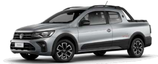
Plata Sirius (Cabina Simple y Cabina Doble)