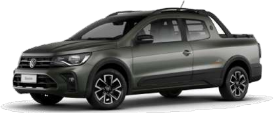
Verde Saga (Extreme)

Las características técnicas y/o equipamiento detallados pueden no corresponder a la oferta real disponible, por favor consulte a un asesor de ventas.