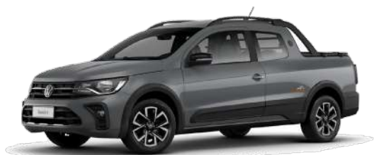
Gris Lunar (Cabina Doble y Extreme)