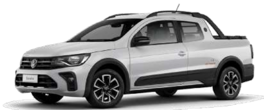
Blanco Cristal (Todas las versiones)